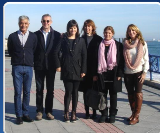
Socios del proyecto durante la reunión de lanzamiento en Santander, España.