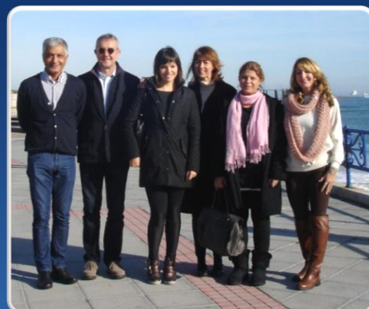
Projektets Kick-off möte ägde rum 8 och 9 januari 2015 i Santander.